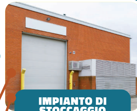
IMPIANTO DI STOCCAGGIO