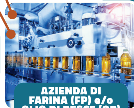
AZIENDA DI FARINA (FP) e/o OLIO DI PESCE (OP)